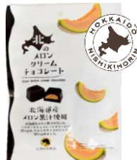
北のメロンクリームチョコレート