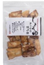
さっくり揚げ煎しょうゆ 内容量：150g 金額：¥432-