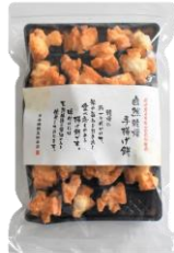
自然乾燥手揚げ煎 内容量：190g 金額：¥1,080-