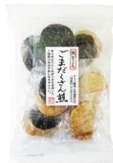
ごまだくさん煎 内容量：20枚 金額：¥378-