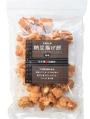
自然乾燥納豆揚げ煎 胡椒 内容量：190g 金額：¥1,080-