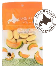
夕張メロンバター餅