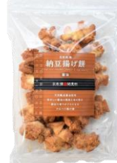
自然乾燥納豆揚げ煎 醤油 内容量：190g 金額：¥1,080-