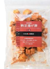
自然乾燥納豆揚げ煎 七味 内容量：190g 金額：¥1,080-