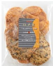
無選別江戸豊 内容量：160g 金額：¥378-