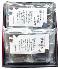
海苔巻き揚げ煎2種詰合せ 内容量：2袋(醤油味①・塩味①) 金額：¥2,592-