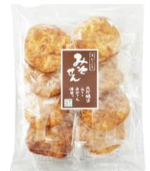
みそ煎 内容量：8枚 金額：¥270-