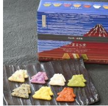
江戸富士七景(42枚入) 内容量：6枚×7種類 金額：¥1,188-