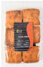
香ばしもち 内容量：135g 金額：¥410-