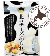
北のチーズあられ