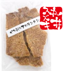
かち割りフロランタン