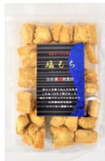
塩もち 内容量：135g 金額：¥410-