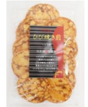
ひび焼き煎 内容量：10枚 金額：¥378-