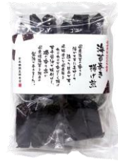
海苔巻き揚げ煎 内容量：3本×8袋 金額：¥1,080-