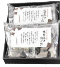
海苔巻き揚げ煎詰合せ(醤油) 内容量：2袋(醤油味) 金額：¥2,592-