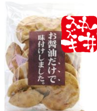
お醤油だけで味付けしました。