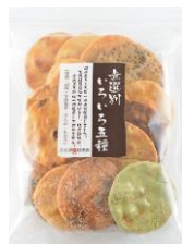
無選別いろいろ五種 内容量：210g 金額：¥378-