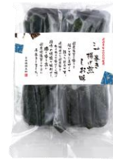
海苔巻き揚げ煎しお味 内容量：3本×8袋 金額：¥1,080-