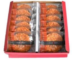
江戸豊12枚 内容量：12枚 金額：¥1,188-