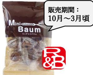
ミニチョコバウム