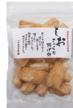
さっくり揚げ煎しお 内容量：160g 金額：¥432-