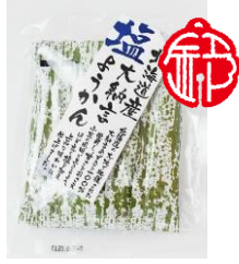
北海道産大納言塩ようかん