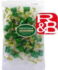
マカダミアスカッチ