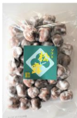
ソフト松露 内容量：190g 金額：¥432-