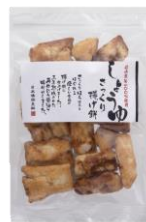
さっくり揚げ煎しょうゆ 内容量：150g 金額：¥432-