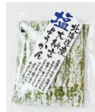
北海道産大納言塩ようかん 内容量：6本 金額：¥324-