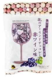
北のアーモンドチョコレート 赤ワイン味