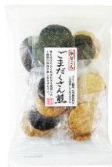
ごまだくさん煎 内容量：20枚 金額：¥378-