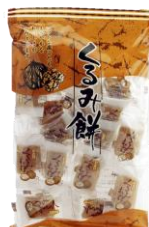
くるみ餅 内容量：200g 金額：¥324-