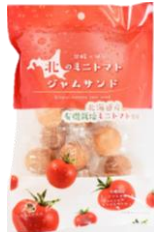
北のミニトマトジャムサンド