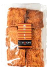
香ばしもち 内容量：135g 金額：¥410-