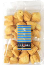
塩もち 内容量：135g 金額：¥410-