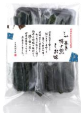
海苔巻き揚げ煎しお味 内容量：3本×8袋 金額：¥1,080-