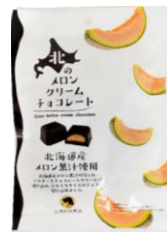
北のメロンクリームチョコレート