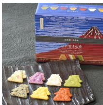
江戸富士七景(42枚入) 内容量：6枚×7種類 金額：¥1,188-