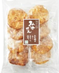
みそ煎 内容量：8枚 金額：¥270-