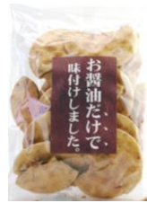
お醤油だけで味付けしました。 内容量：150g 金額：¥324-