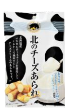
北のチーズあられ 内容量：70g 金額：¥410-