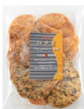
無選別江戸豊 内容量：160g 金額：¥378-