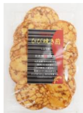
ひび焼き煎 内容量：10枚 金額：¥378-