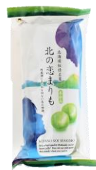
北の恋まりも羊かん 内容量：10個 金額：¥594-