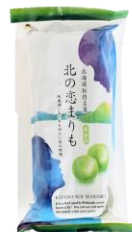
北の恋まりも羊かん 内容量：10個 金額：¥594-