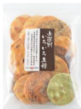
無選別いろいろ五種 内容量：210g 金額：¥378-