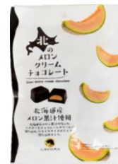
北のメロンクリームチョコレート