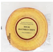
ミルクバウム 内容量：1個 金額：¥432-