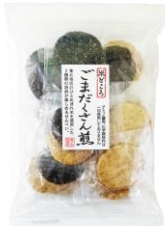
ごまだくさん煎 内容量：20枚 金額：¥378-