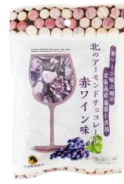
北のアーモンドチョコレート 赤ワイン味