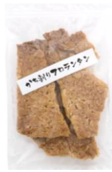
から割りフロランタン