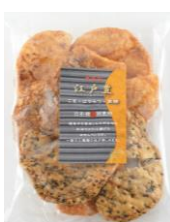
無選別江戸豊 内容量：160g 金額：¥378-