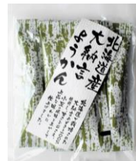
北海道産大納言ようかん 内容量：6本 金額：¥324-