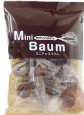
ミニチョコバウム 内容量：150g 金額：¥324-