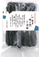
海苔巻き揚げ煎しお味 内容量：3本×8袋 金額：¥1,080-