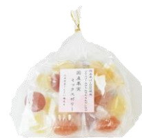
巾着国産果実ミックスゼリー