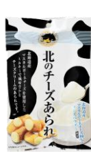
北のチーズあられ 内容量：70g 金額：¥410-