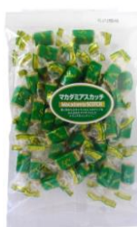
マカダミアスカッチ