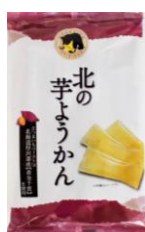
北の羊ようかん 内容量：14本 金額：¥518-