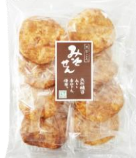
みそ煎 内容量：8枚 金額：¥270-