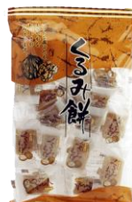
くるみ餅 内容量：200g 金額：¥324-