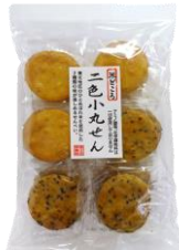
二色小丸せん 内容量：18枚 金額：¥378-