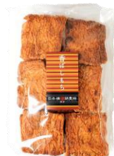
香ばしもち 内容量：135g 金額：¥410-