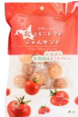
北のミニトマトジャムサンド