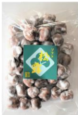
ソフト松露 内容量：190g 金額：¥432-