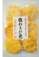
塩わさび煎 内容量：12枚 金額：¥270-