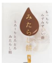
みたらし餅 内容量：5個 金額：¥324-