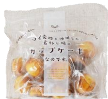
ライ麦粉を使用したカップケーキ 内容量：14個 金額：¥432-