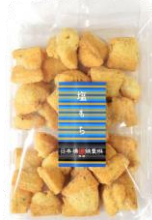
塩もち 内容量：135g 金額：¥410-