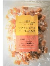
マスカルポーネチーズのおかき 内容量：300g 金額：¥1,296-