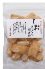
さっくり揚げ餅しお 内容量：160g 金額：¥432-