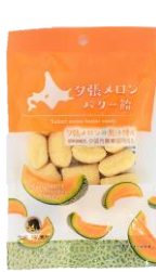
夕張メロンバター船