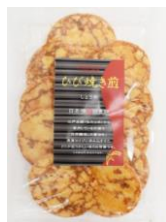
ひび焼き煎 内容量：10枚 金額：¥378-