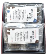
海苔巻き揚げ煎2種詰合せ 内容量：2袋(醤油味①・塩味①) 金額：¥2,592-

※表示金額は全て『税込価格』となります ※ご注文商品代金が¥8,640-以上で送料無料となります(1か所につき)