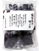
海苔巻き揚げ煎 内容量：3本×8袋 金額：¥1,080-