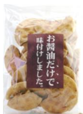
お醤油だけで味付けしました。 内容量：150g 金額：¥324-