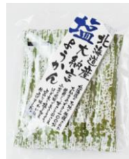
北海道産大納言塩ようかん 内容量：6本 金額：¥324-