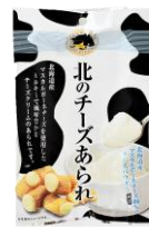
北のチーズあられ 内容量：70g 金額：¥410-