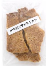
かち割りフロランタン