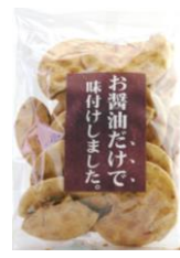
お醤油だけで味付けしました。 内容量：150g 金額：¥324-