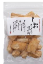
さっくり揚げ餅しお 内容量：160g 金額：¥432-