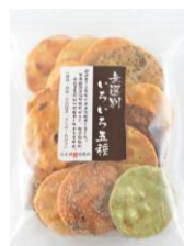
無選別いろいろ五種 内容量：210g 金額：¥378-