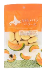
夕張メロンバター飴