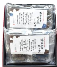
海苔巻き揚げ煎2種詰合せ 内容量：2袋(醤油味①・塩味①) 金額：¥2,592-