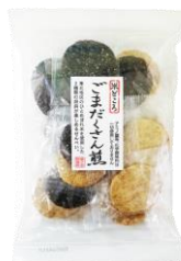
ごまだくさん煎 内容量：20枚 金額：¥378-