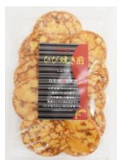
ひび焼き煎 内容量：10枚 金額：¥378-