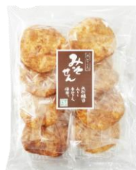
みそ煎 内容量：8枚 金額：¥270-