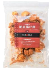
自然乾燥納豆揚げ餅 七味 内容量：190g 金額：¥1,080-