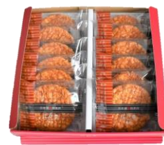
江戸豊12枚 内容量：12枚 金額：¥1,188-