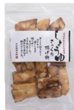
さっくり揚げ餅しょうゆ 内容量：150g 金額：¥432-