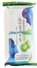
北の恋まりも羊かん