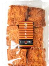
香ばしもち 内容量：135g 金額：¥410-