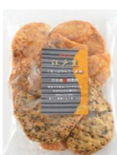
無選別江戸豊 内容量：160g 金額：¥378-