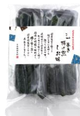
海苔巻き揚げ煎しお味 内容量：3本×8袋 金額：¥1,080-