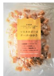
マスカルポーネチーズのおかき 内容量：300g 金額：¥1,296-