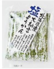
北海道産大納言塩ようかん