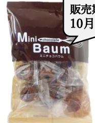
ミニチョコバウム