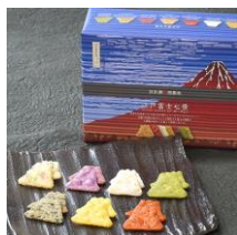
江戸富士七景(42枚入) 内容量：6枚×7種類 金額：¥1,188-