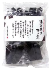
海苔巻き揚げ煎 内容量：3本×8袋 金額：¥1,080-