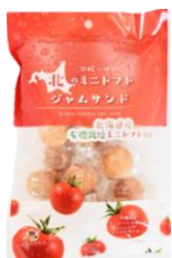
北のミニトマトジャムサンド