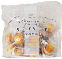
ライ麦粉を使用したカップケーキ