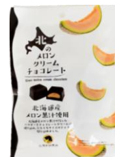
北のメロンクリームチョコレート