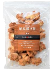
自然乾燥納豆揚げ餅 醤油 内容量：190g 金額：¥1,080-