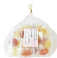
巾着国産果実ミックスゼリー