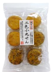
二色小丸せん 内容量：18枚 金額：¥378-