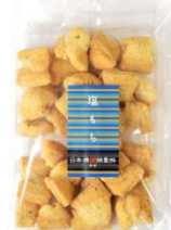
塩もち 内容量：135g 金額：¥410-