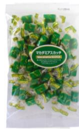
マカダミアスカッチ