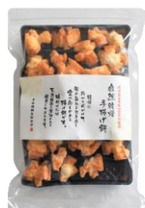
自然乾燥手揚げ餅 内容量：190g 金額：¥1,080-