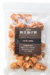
自然乾燥納豆揚げ餅 胡椒 内容量：190g 金額：¥1,080-