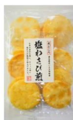
塩わさび煎 内容量：12枚 金額：¥270-