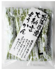
北海道産大納言ようかん