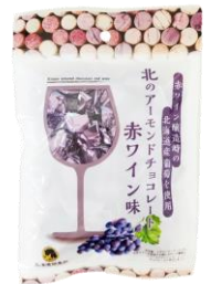
北のアーモンドチョコレート 赤ワイン味