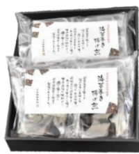
海苔巻き揚げ煎詰合せ(醤油) 内容量：2袋(醤油味) 金額：¥2,592-