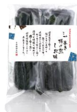
海苔巻き揚げ煎しお味 内容量：3本×8袋 金額：¥1,080-