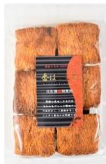
香ばしもち 内容量：135g 金額：¥410-