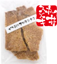
かち割りフロランタン 内容量：270g 金額：¥1,080-