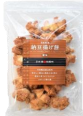
自然乾燥納豆揚げ煎 醤油 内容量：190g 金額：¥1,080-