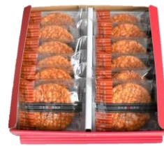
江戸豊12枚 内容量：12枚 金額：¥1,188-