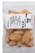
さっくり揚げ煎しお 内容量：160g 金額：¥432-