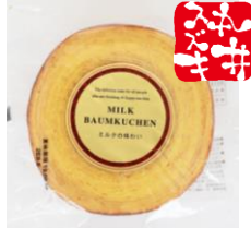
ミルクバウム 内容量：1個 金額：¥432-