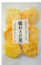
塩わさび煎 内容量：12枚 金額：¥270-