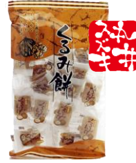
くるみ餅 内容量：200g 金額：¥324-