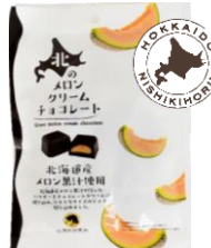
北のメロンクリームチョコレート 内容量：56g 金額：¥410-