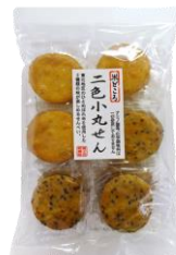
二色小丸せん 内容量：18枚 金額：¥378-