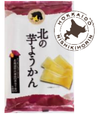
北の芋ようかん 内容量：14本 金額：¥518-