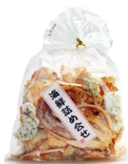
海鮮詰め合せ 内容量：135g 金額：¥378-