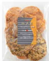
無選別江戸豊 内容量：160g 金額：¥378-