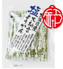
北海道産大納言塩ようかん 内容量：6本 金額：¥324-