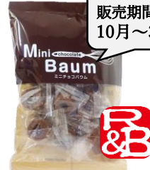
ミニチョコバウム 内容量：150g 金額：¥324-