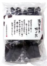
海苔巻き揚げ煎 内容量：3本×8袋 金額：¥1,080-