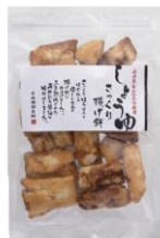
さっくり揚げ煎しょうゆ 内容量：150g 金額：¥432-