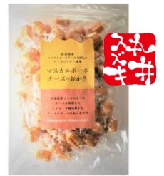
マスカルポーネチーズのおかき 内容量：300g 金額：¥1,296-