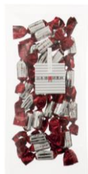
アーモンドスカッチ (プレーン・コーヒー・オレンジ) 内容量：100g 金額：¥432-