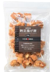
自然乾燥納豆揚げ煎 胡椒 内容量：190g 金額：¥1,080-