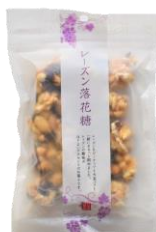
レーズン落花糖 内容量：140g 金額：¥378-