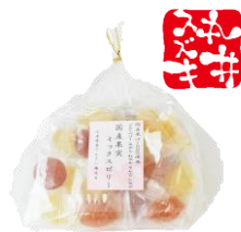
巾着国産果実ミックスゼリー 内容量：200g 金額：¥648-