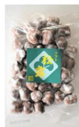
ソフト松露 内容量：190g 金額：¥432-