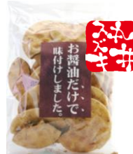
お醤油だけで味付けしました。 内容量：150g 金額：¥324-