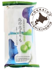
北の恋まりも羊かん 内容量：10個 金額：¥594-