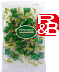
マカダミアスカッチ 内容量：120g 金額：¥432-