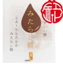
みたらし餅 内容量：5個 金額：¥324-