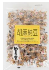
胡麻納豆 内容量：120g 金額：¥378-