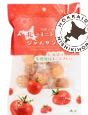
北のミニトマトジャムサンド 内容量：100g 金額：¥410-