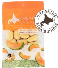
夕張メロンバター飴 内容量：80g 金額：¥270-