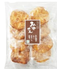
みそ煎 内容量：8枚 金額：¥270-