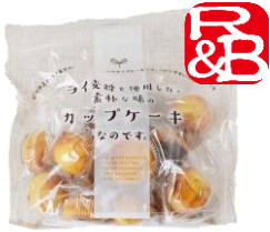
ライ麦粉を使用したカップケーキ 内容量：14個 金額：¥432-