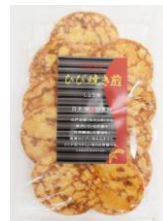
ひび焼き煎 内容量：10枚 金額：¥378-