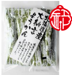
北海道産大納言ようかん 内容量：6本 金額：¥324-