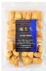
塩もち 内容量：135g 金額：¥410-