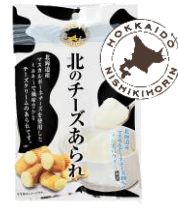
北のチーズあられ 内容量：70g 金額：¥410-