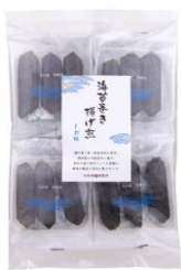
【日本橋錦豊琳】 海苔巻き揚げ煎しお味 内容量：3本×8袋 金額：¥1,296-