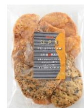
【錦豊琳】 無選別江戸豊 内容量：160g 金額：¥410-