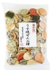
【錦豊琳】 うす焼せん六種 内容量：100g 金額：¥410-