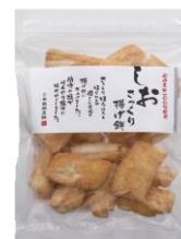
【日本橋錦豊琳】 さっくり揚げ餅しお味 内容量：148g 金額：¥432-