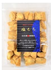
【日本橋錦豊琳】 塩もち 内容量：135g 金額：¥453-