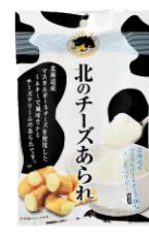
【北海道錦豊琳】 北のチーズあられ 内容量：70g 金額：¥410-