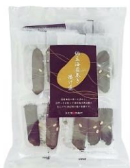
【日本橋錦豊琳】 納豆海苔巻き揚げ煎 内容量：3本×7袋 金額：¥1,296-