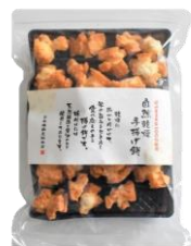
【日本橋錦豊琳】 自然乾燥手揚げ餅 内容量：190g 金額：¥1,080-