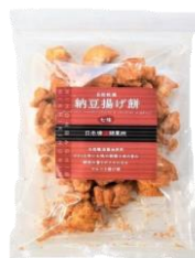
【日本橋錦豊琳】 自然乾燥納豆揚げ餅 七味 内容量：190g 金額：¥1,080-