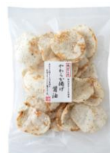
【錦豊琳】 やわらか揚げ醤油 内容量：70g 金額：¥303-