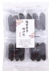
【日本橋錦豊琳】 海苔巻き揚げ煎 内容量：3本×8袋 金額：¥1,296-