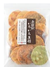
【錦豊琳】 無選別いろいろ五種 内容量：210g 金額：¥464-