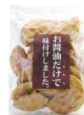
【丸井スズキ】 お醤油だけで味付けしました。 内容量：150g 金額：¥378-