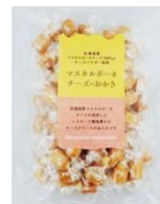
【丸井スズキ】 マスカルポーネチーズのおかき 内容量：300g 金額：¥1,404-