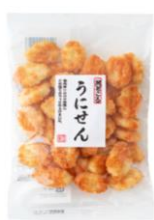
【錦豊琳】 うにせん 内容量：80g 金額：¥324-