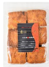
【日本橋錦豊琳】 香ばしもち 内容量：135g 金額：¥453-