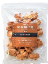
【日本橋錦豊琳】 自然乾燥納豆揚げ餅 醤油 内容量：190g 金額：¥1,080-