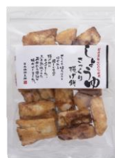
【日本橋錦豊琳】 さっくり揚げ餅しょうゆ 内容量：138g 金額：¥432-