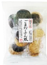
【錦豊琳】 ごまだくさん煎 内容量：18枚 金額：¥410-