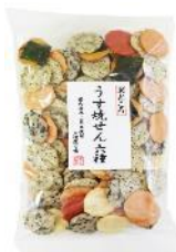
【錦豊琳】 うす焼せん六種 内容量：100g 金額：¥410-