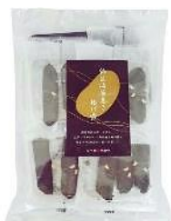
【日本橋錦豊琳】 納豆海苔巻揚げ煎 内容量：3本×7袋 金額：¥1,296-