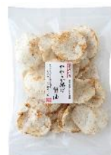
【錦豊琳】 やわらか揚げ醤油 内容量：70g 金額：¥324-