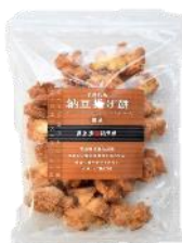
【日本橋錦豊琳】 自然乾燥納豆揚げ餅 醤油 内容量：190g 金額：¥1,080-