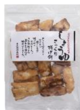
【日本橋錦豊琳】 さっくり揚げ餅しょうゆ 内容量：138g 金額：¥432-