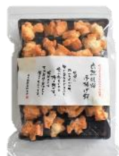
【日本橋錦豊琳】 自然乾燥手揚げ餅 内容量：190g 金額：¥1,080-