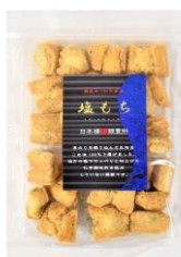
【日本橋錦豊琳】 塩もち 内容量：135g 金額：¥453-