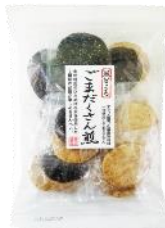
【錦豊琳】 ごまだくさん煎 内容量：18枚 金額：¥410-