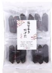
【日本橋錦豊琳】 海苔巻き揚げ煎 内容量：3本×8袋 金額：¥1,296-