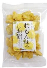
【日本橋錦豊琳】 れもん味のしお餅 内容量：135g 金額：¥453- 休売中 (夏季限定販売)