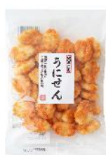
【錦豊琳】 うにせん 内容量：80g 金額：¥324-