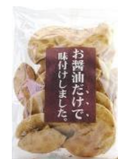
【丸井スズキ】 お醤油だけで味付けしました。 内容量：150g 金額：¥378-