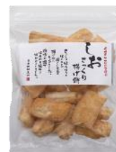
【日本橋錦豊琳】 さっくり揚げ餅しお味 内容量：148g 金額：¥432-