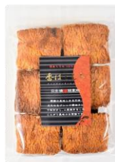
【日本橋錦豊琳】 香ばしもち 内容量：135g 金額：¥453-