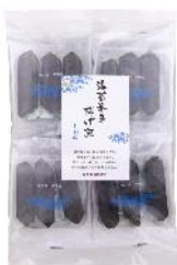
【日本橋錦豊琳】 海苔巻き揚げ煎しお味 内容量：3本×8袋 金額：¥1,296-