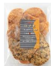
【錦豊琳】 無選別江戸豊 内容量：160g 金額：¥410-