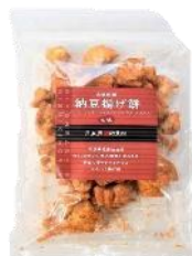
【日本橋錦豊琳】 自然乾燥納豆揚げ餅 七味 内容量：190g 金額：¥1,080-