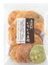
【錦豊琳】 無選別いろいろ五種 内容量：210g 金額：¥464-