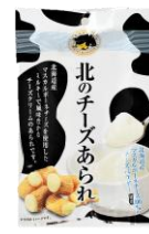
【北海道錦豊琳】 北のチーズあられ 内容量：70g 金額：¥410-